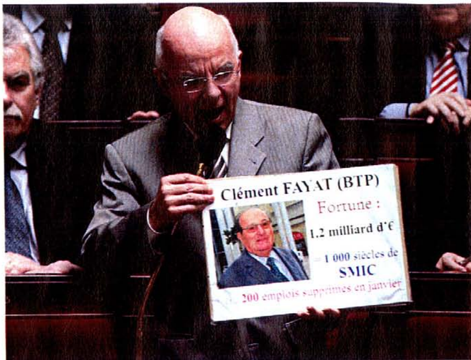
Jean-Pierre Brard (PCF). Il est le premier du classement. L'intervention en séance, maîtrise et à l'air de l'apprécier. Comme sur le débat sur la réforme des retraites où sort de grands cartons avec diagrammes.

Pour obtenir le classement le plus sérieux possible, nous avons, au prix d'un travail de lon-